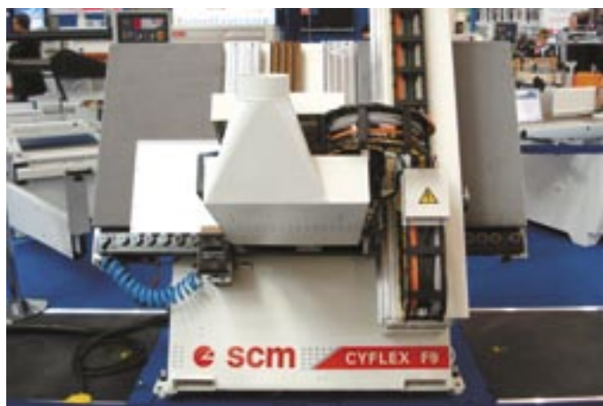
SCM CYFLEX F9 fúróközpont

megmunkálóközponttal, de annak kapacitását a bonyolultabb fúrásértékek lekötik. A CYFLEX F9 fúróközpont „hadrendbe” állításával a CNC-megmunkálóközponton jelentős gépi idő takarítható meg, melyet bonyolultabb munkákra használhatunk.