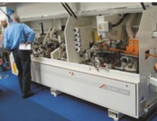
SCM OLIMPIC K500 elzáró automata