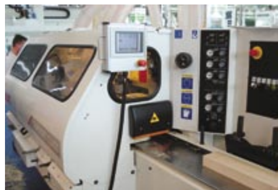
SCM MOBIL 10 vezérlőpanel