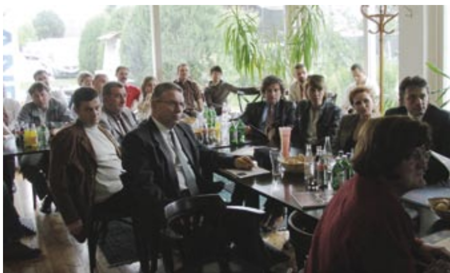
Sok érdeklődő volt kíváncsi az Anest szombati, a magyar bútortalakkal foglalkozó műhelybeszélgetésére is