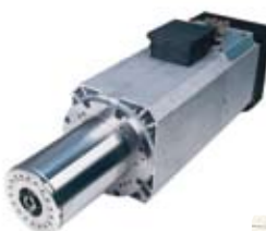
1 kW-os elektrotengely