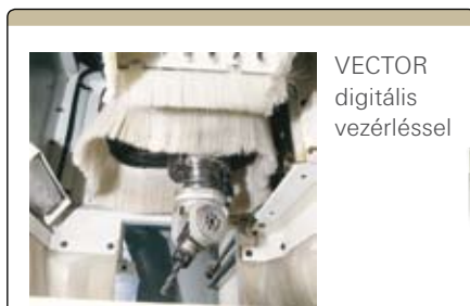
VECTOR digitális vezérléssel

Az új fejlesztésű kompakt élzáró rendelkezik minden olyan tulajdonsággal, ami a profi élzáráshoz szükséges (merev gépváz, robotsztus, kiforrott egységek, megfelelő elszívás, stb.). Alsó tartályos ragasztó rendszer, ferdepályás végvágó, szintbemaró, ziehklings, polírszárító egységek gondoskodnak a jó minőségű élzárásról. ORION ONE elektronikus vezérlés