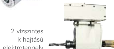
2 vízszintes kihajtású elektrotengely