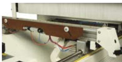
TV munkaasztal alkatrészkiemelővel